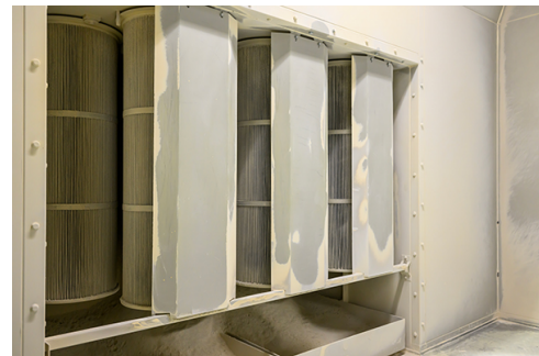
塗装ブース（集塵式）